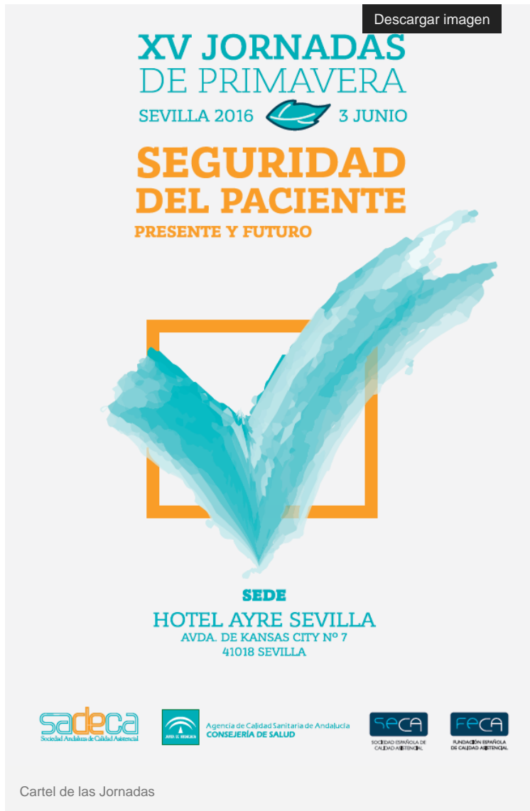
Cartel de las Jornadas