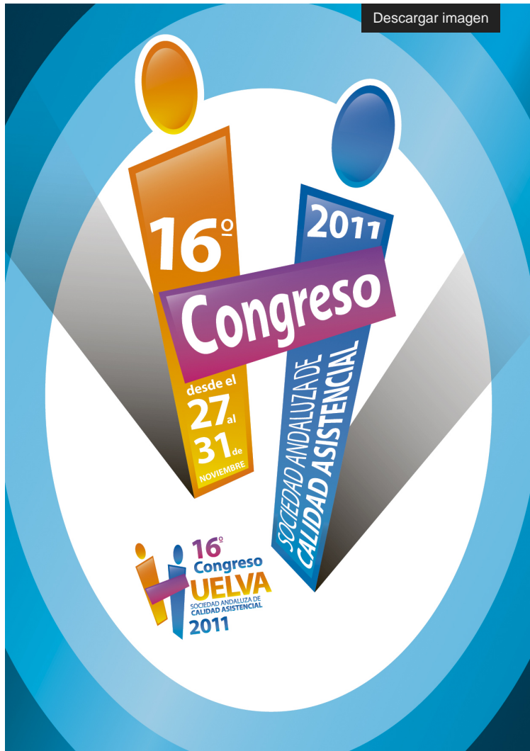
Cartel del Congreso

Huelva acoge en 2.011 el XVI Congreso de la Sociedad Andaluza de Calidad Asistencial. Desde la Dirección de la SADECA y los Comités Organizador y Científico deseamos animaros a participar. Solo la presencia de los profesionales puede garantizar que este Congreso, que desea convertirse en un foro de participación, intercambio de ideas y aprendizaje, pueda resultar un éxito.